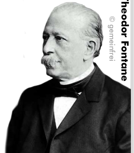
Theodor Fontane

Was bei dem Schiffsunglück geschehen ist, erfährst du auf den folgenden Seiten.