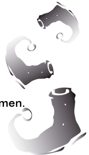
Es regnet Schuhe